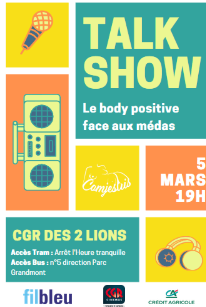
Affiche du Talk Show