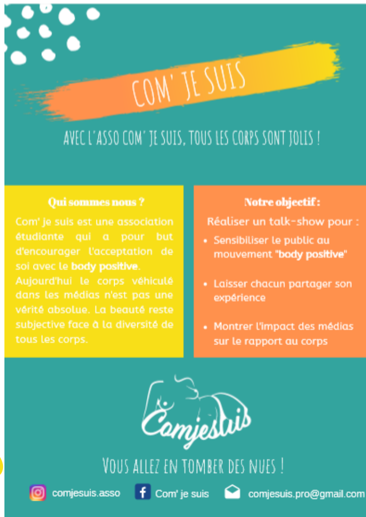
Flyers de l'association